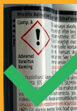
Faremærkning på SikaForce® 302

Sika Danmark A/S Hirsemarken 5 3520 Farum