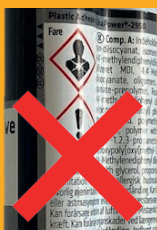
Faremærkning på SikaPower® 2950

De nye SikaForce ® produkter erstatter vores SikaPower® plastlime. Den nye serie er bl.a. forbedret i forhold til MAL-koden, hvilket også har betydning for faremærkningerne.